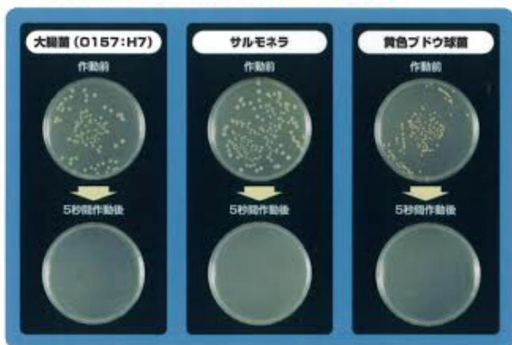
試験：日本食品分析センター 第107012770-001号 2007.3.1