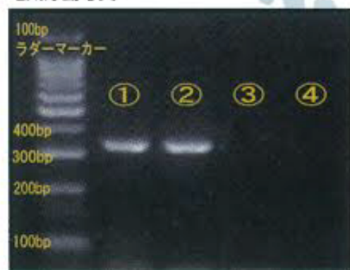
(ノロウイルス陽性の場合は344bpの位置にバンドが出現)